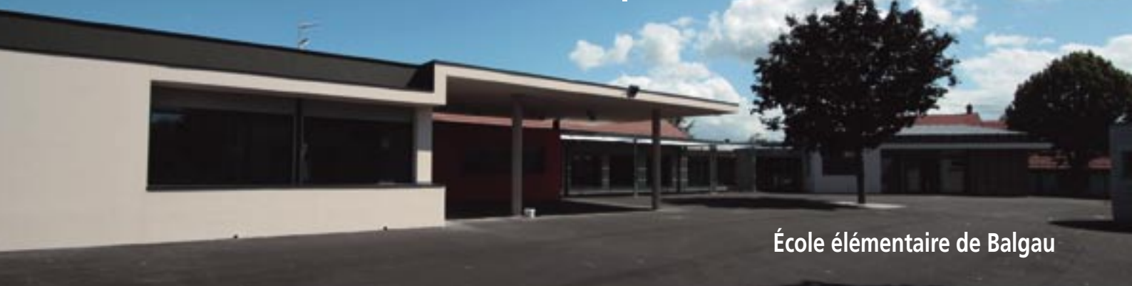
École élémentaire de Balgau

De vastes projets ont vu le jour sous maîtrise d'ouvrage déléguée* à la Com Com depuis un an. D'autres sortiront de terre d'ici la fin de l'année.