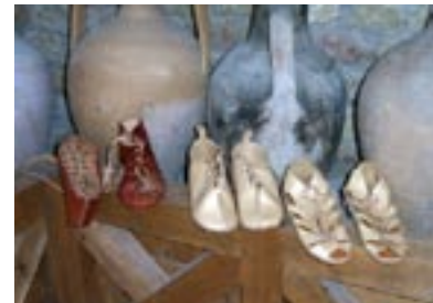
Musée romain - Villa Urbana

De l'autre côté du Rhin, à quelques kilomètres du pont de la Hardt Erich Dilger - Alain Foechterlé, nous vous invitons à découvrir la ville de Heimersheim. Vous pourrez faire des promenades idylliques le long du ruisseau Sulzbach ou, pour plus de curiosité, visiter les musées et le château. La ville de Heimersheim est jumelée avec Vandans en Autriche.